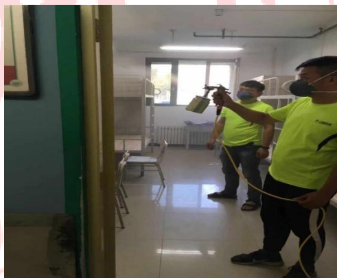
△环境检测与空气治理