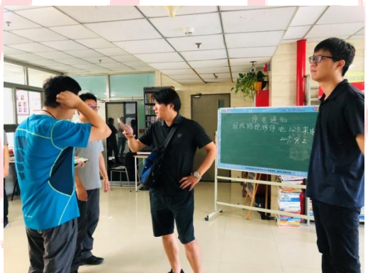
△家属区工程（左）、品园6楼工程（右）验收