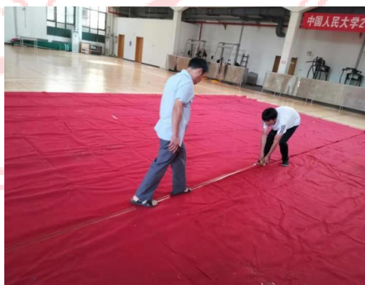
△庶务组与门锁组工作纪实