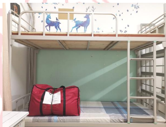
△被服放置于新生床铺