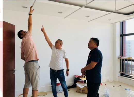
△汇贤楼B座工程验收