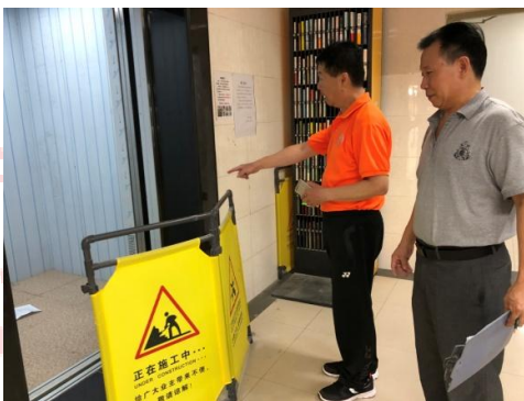
△电梯拆装工程现场