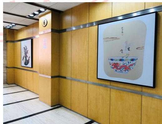
△汇贤楼B座新增宿舍