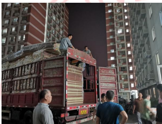
△夜以继日 运输被服

经半个月的在线预订，截止 8 月 28 日，新生被服预订工作已顺利完成。经数据统计，今年新生共计订购被服 2013 套。接下来，为确保进场秩序，提高运输效率，部门制定进场顺序，尽量避免三家被服供应商同时进场的交叉作业。2000 余套被服于 9 月 3 日晚正式进校，经两天两夜的连续作战，被服包裹逐一运送至新生床铺。今年是新生被服一站式服务运行的第 5 年，该项目改变了传统被服现场售卖拥挤、排队的现象，也真正从人性化、安全的角度解决了学生被服购置的后顾之忧。