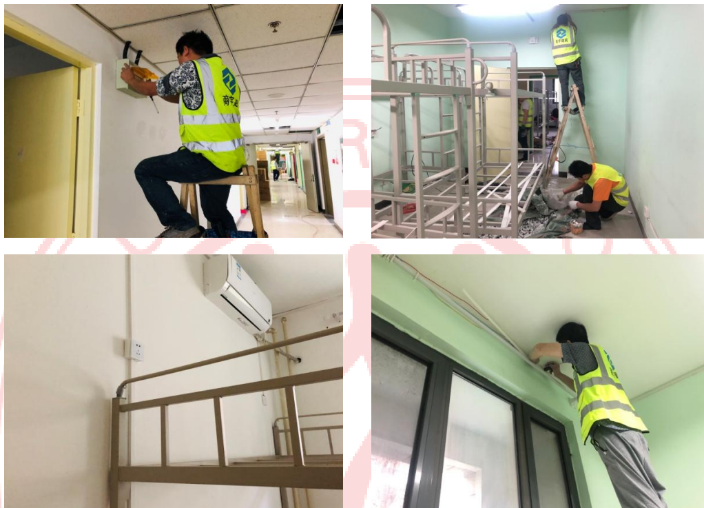
△消防报警系统（上）、电改造（下）施工现场

暑期实施的品园 6 楼毕业生宿舍电路改造与消防报警系统改造工程已经接近尾声。目前毕业生宿舍电路改造已完成，消防报警系统改造工程进入收口工作。截止 8 月 25 日，消防报警系统改造工程的穿线、打眼及设备更换工序已经完成，已进入设备调试及接线阶段，防火门更新工程也已完成。同时，施工材料同步清理出楼。