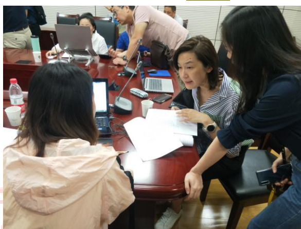
△汇贤大厦 B 座新增学生宿舍立项