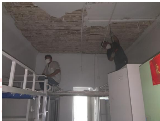
△对红 3 楼吊顶进行修缮

为消除安全隐患，部门经与资产与后勤管理处协调后，协同运营部及物业管理部修缮服务中心，现场踏勘确定施工方案，于 7 月 16 日正式开始了红 3 楼吊顶修缮工程。同时，施工单位、网络、消防烟感厂家协调入场，预计 8 月 20 日结束施工。