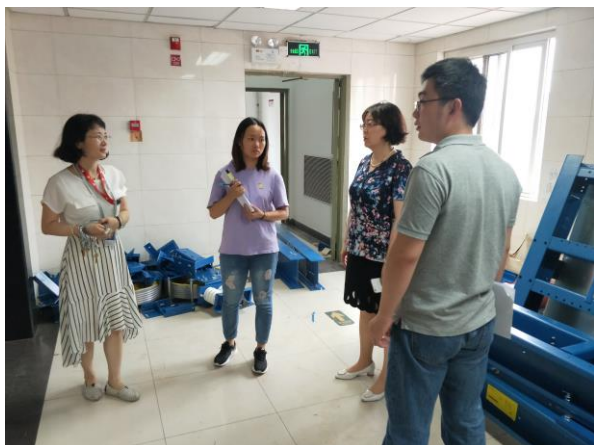
△配合专家对知行 5 楼进行现场踏勘