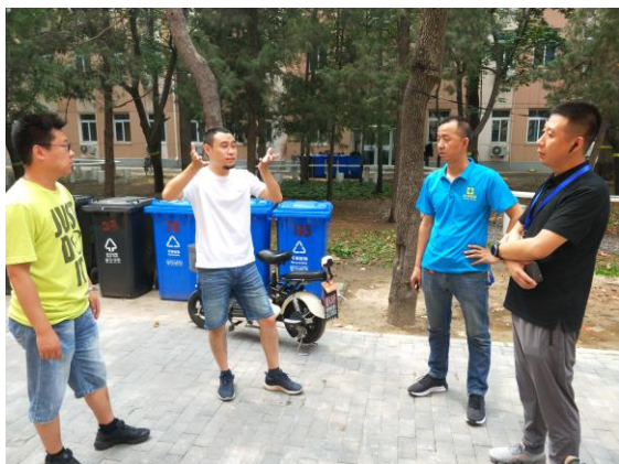
△现场商讨工程进度