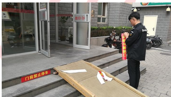
△安办张贴消防安全标识

7月1日至7月10日，安全管理办公室做好毕业生楼宇门前的安全检查工作，在品园5楼、品园6楼、知行1楼、知行2楼门前设置固定岗位进行进出秩序监督管理。同时，针对毕业季及暑期施工期间，人员进出楼宇情况复杂，容易有吸烟及堵塞消防通道等情况，安办加强对各楼宇的防火安全巡查等工作。