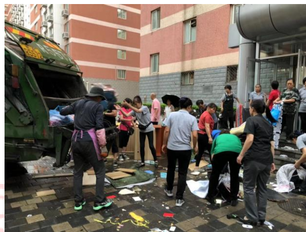
△毕业生宿舍垃圾出楼、清运