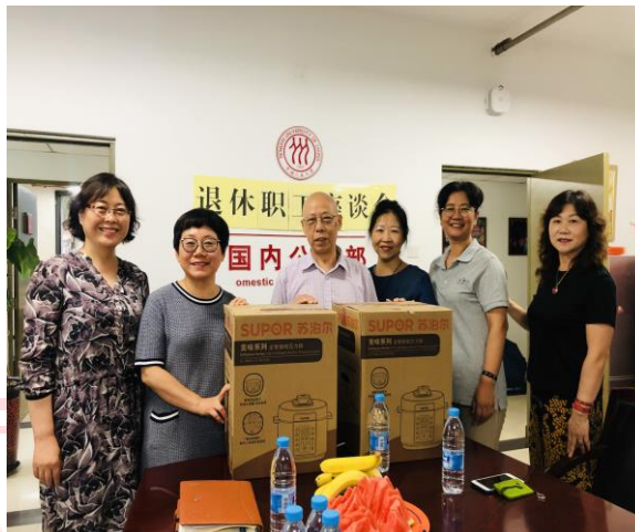
△退休员工座谈会现场

7月10日上午，部门为两位退休员工举办了座谈会。会上，部门领导首先对两位老同志多年来为国内公寓部的辛苦工作和付出表示肯定和感谢。工会公寓分会也为他们准备了礼物。退休员工回忆了来到部门后的点点滴滴，同时表示希望年轻的同事们，在岗位上能够更好地工作，发扬公寓精神，传承公寓人的工作理念，干一行爱一行。部门的同事们也对前辈表示了深深地祝福，退休也是新生活的开始，希望他们退休后的生活充实、快乐。