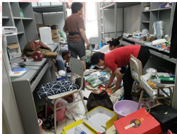
△保洁清扫毕业生宿舍