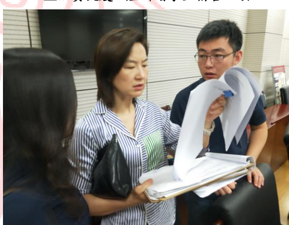
△工程立项评审现场