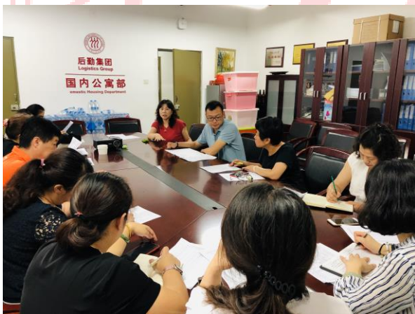
△暑期工作部署会现场

7月16日，部门召开了暑期工作部署会，各学生公寓楼长及保洁主管参加。会议通报了2019年暑期各学生公寓整修工程的现场踏勘工程量情况，要求各楼长在暑期工程期间，注意楼内人员进出，保障学生公寓的安全，做好暑期工程的应对工作。对于国小退宿房间，保洁要与庶务组做好工作交接，统筹规划，及时清理房间，各楼长也要做好毕业生房间家具、门窗、电等维修检查，列好清单以备开学前再次核查。