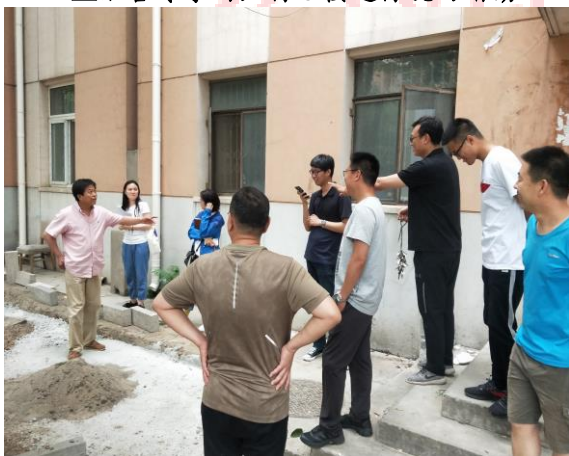
△新增学生宿舍现场踏勘