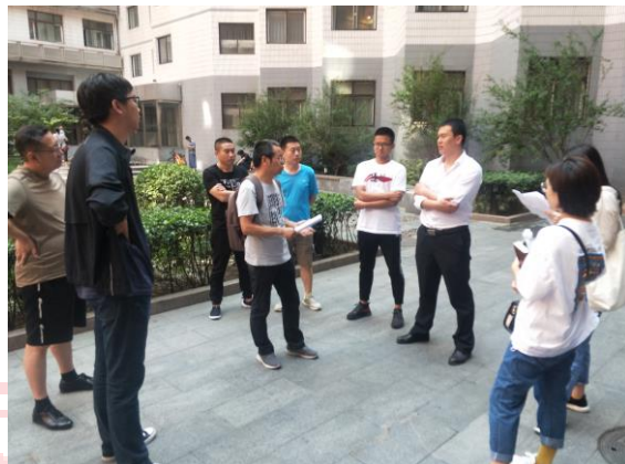
△多部门联合踏勘新增学生宿舍