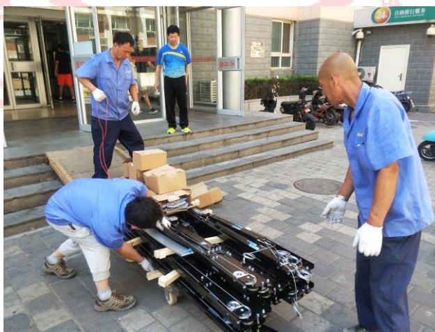
△电梯更换零部件进场